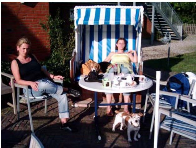
Ab in den Strandkorb!