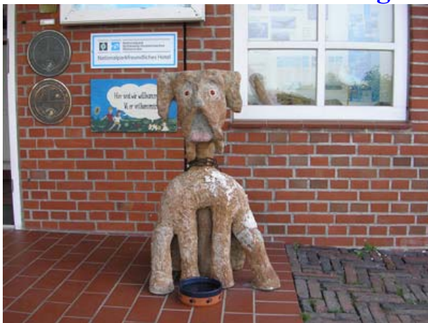
Hier sind wir richtig