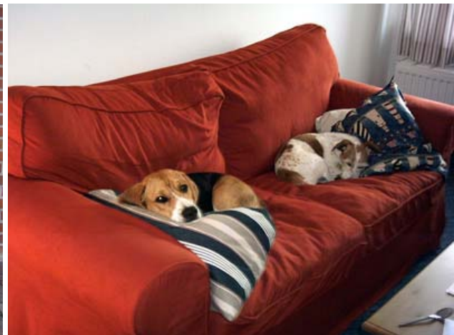
Ausruhen nach der langen Reise