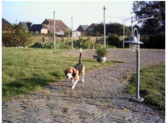
Schon schön, so ein Garten