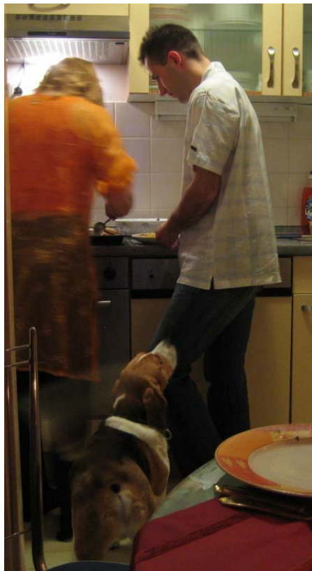
beim Kochen, Grillen und Spülen.