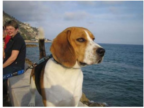
Und ständig rief wer Paacoo Footoo! Ging wohl nicht ohne mich.